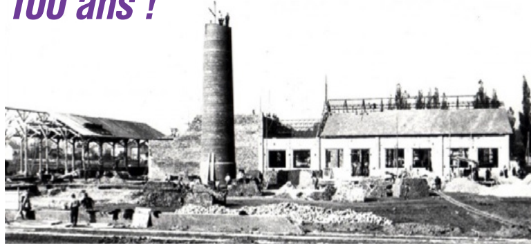
Usine de Pont-de-Claix, 1915.