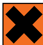
Nocif ou irritant