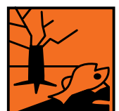
Dangereux pour l'environnement

Comment VOUS en débarrasser proprement ?