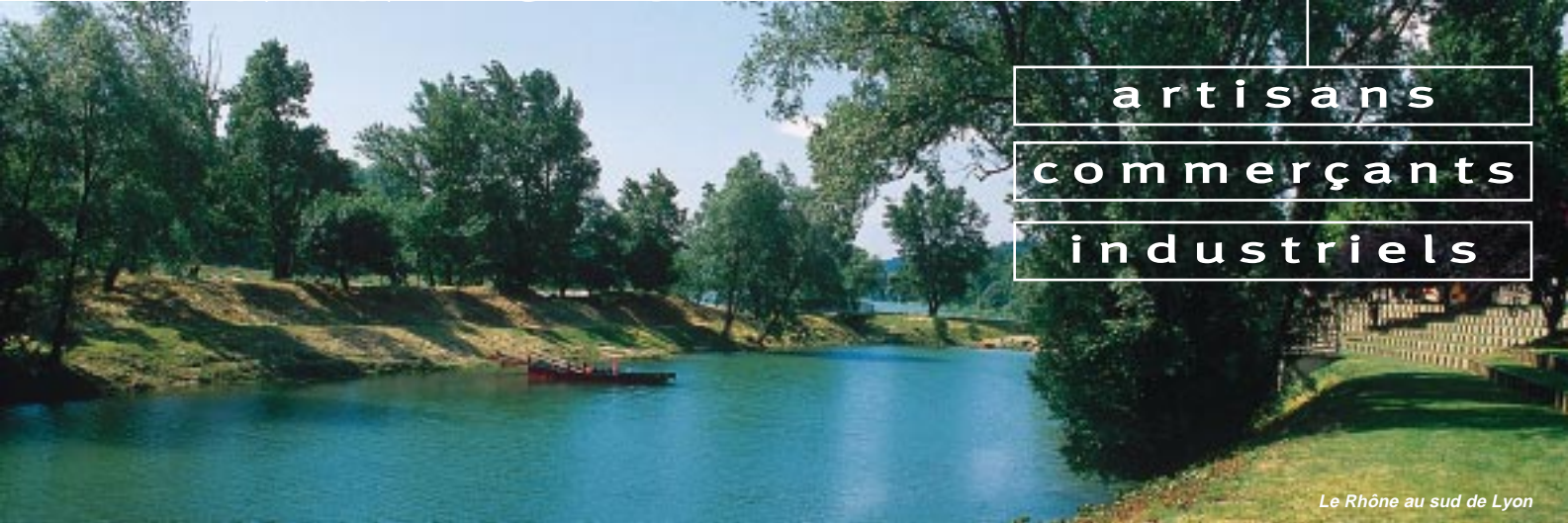
Le Rhône au sud de Lyon