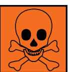
T ou T+ Toxique