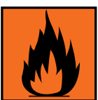
F ou F+ Inflammable